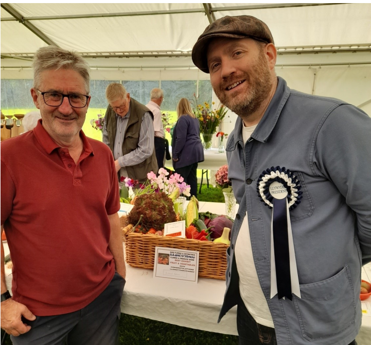
Ydy Bryn yn mynd i archebu llysiau o Landyrnog i'w gweini yn ei fwytai?