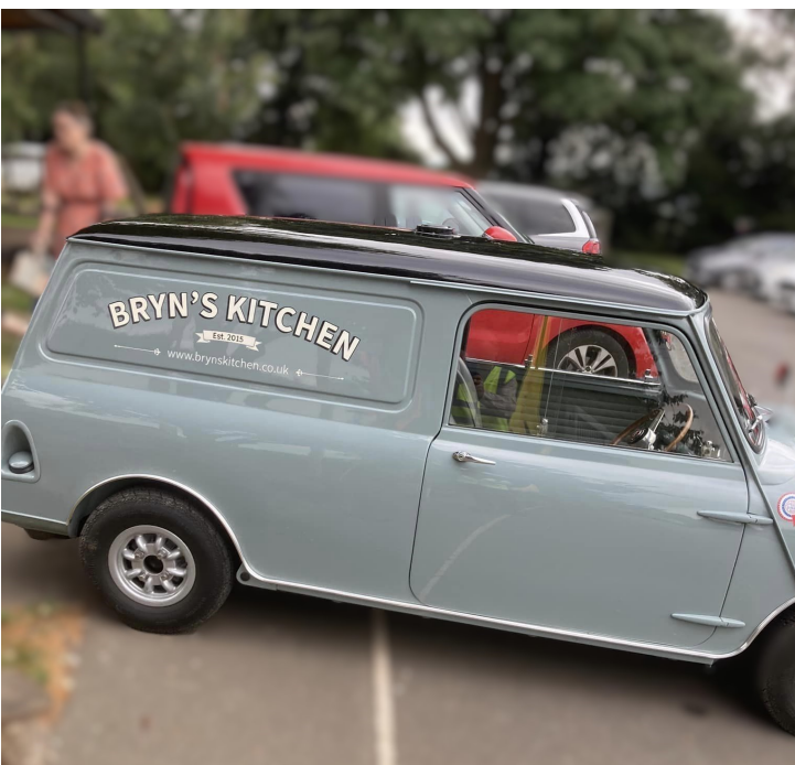
Y fan yn barod i gasglu nwyddau!