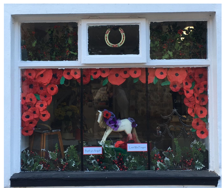
Roedd ffenest Tŷ Ceffyl Bach wedi’i haddurno’n hardd iawn i goffáu Dydd y Cadoediad.