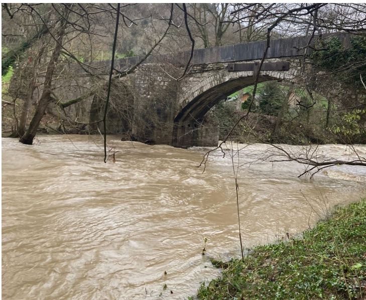
Pont Bontnewydd – a’r afon yn ei llawn lif

Diolch o galon i bawb a gefnogodd y boreau coffi ym mis Tachwedd: